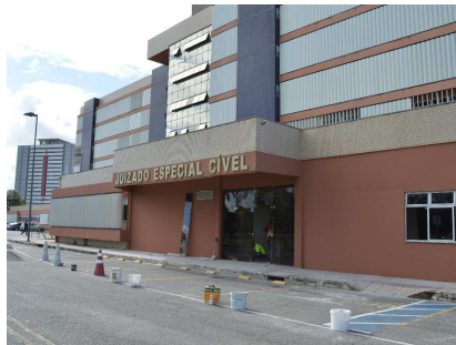
Obra da reforma sendo finalizada

O edifício sede da Justiça Federal em Alagoas (JFAL), Fórum Juiz Carlos Gomes de Barros, finalizou mais uma etapa da ampla reforma e de várias obras para recuperação, manutenção e modernização de suas dependências e instalações. A inauguração será dia 18 de junho, às 17h, em solenidade no prédio sede da JFAL.