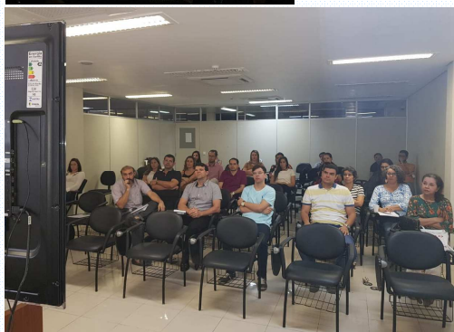
Servidores participam de curso por videoconferência

A Lei dispõe ainda, sobre o cálculo do benefício especial, no âmbito daquele Conselho e da Justiça Federal de primeiro e segundo grau. A opção pela migração deverá ser realizada por meio do preenchimento do formulário contido no Anexo I da Resolução (que está no Sistema SEI), para o Núcleo de Gestão de Pessoas da Seção Judiciária.